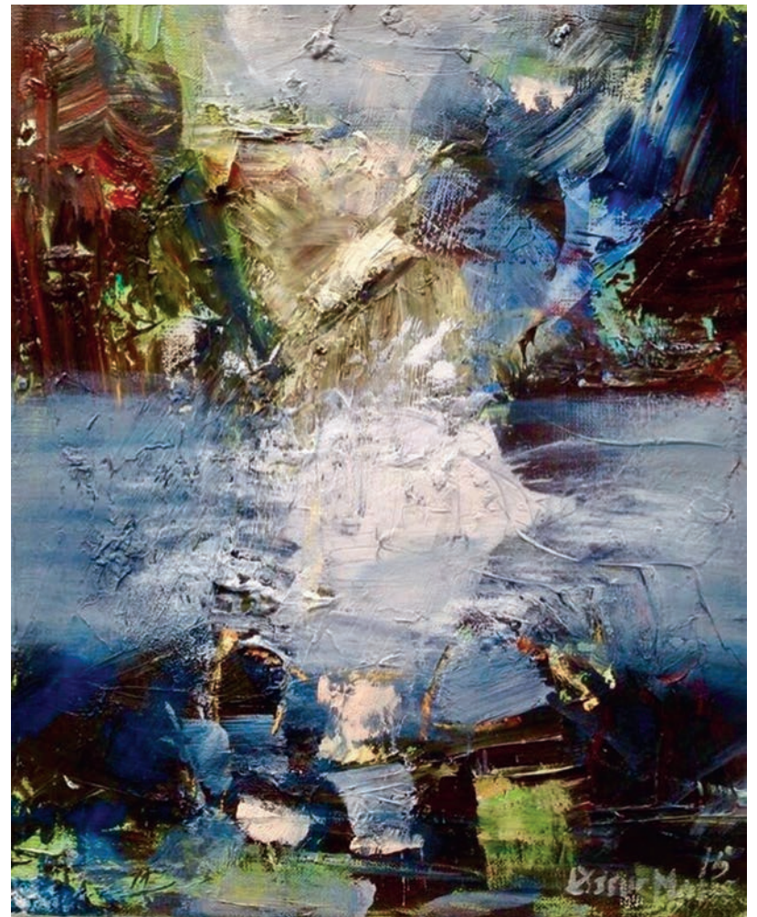
Fjordens foranderlighed i olie og lag på lag.

I manges øjne ligner mine malerier nok hinanden. Jeg står ikke og funderer over, hvordan jeg maler eller forsøger bevidst at fremdyrke et bestemt kendetegn. Jeg tvivler faktisk på, om det kan lade sig gøre, for egentlig er mine malerier bare en forlængelse af mig som menneske, så det kan næppe være anderledes.